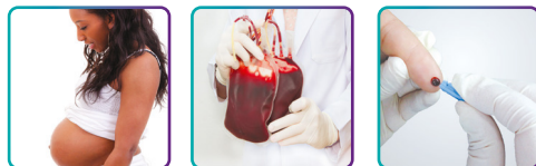
Dažāda veida paraugu izmantošana

Salīdzinoši neseno ASV Pārtikas un Zāļu administrācija (FDA) ir apstiprinājusi 4. paaudzes HIV testus, kuri papildus IgG un IgM antivielām nosaka p24 antigēnu, kas ļauj diagnosticēt HIV infekciju jau 14 dienu laikā pēc inficēšanās.